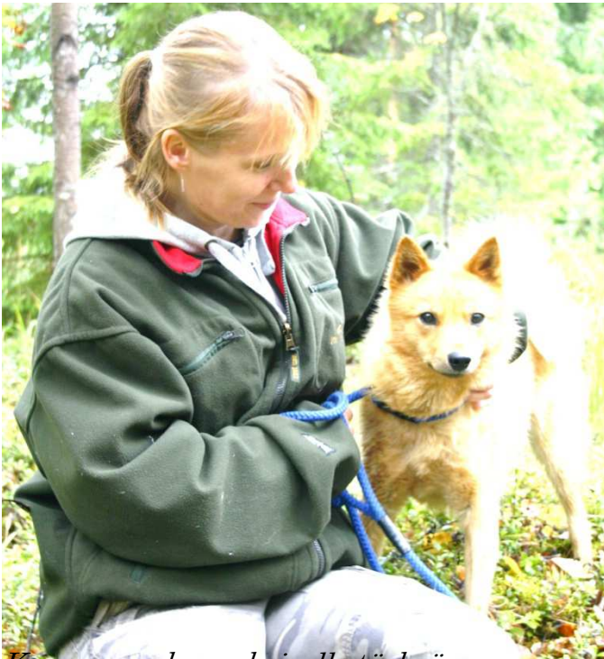
Kunnon ruoka on koiralle tärkeä

Omat kokemukset on pistänyt pohtimaan, että kuinka moni mahdollisesti saakaan sen toimimattoman koiran, tai koira saa jopa monttutuomion, pelkästään sille soveltumattoman ravinnon vuoksi.